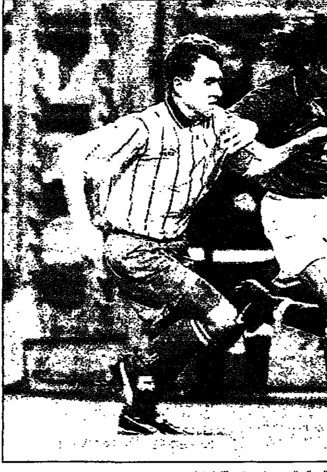
باولو مالديني لاعب المنتخب الإيطالي إلى اليمين (صورة من الأرشيف)

شركات توظيف أموال وضمان أموال المودعين. وفي المجموعة الثالثة ستلعب أيرلندا مع فنلندا في بكن. وفي تصفيات أمريكا الجنوبية فقد تقدم كولومبيا صدارة المجموعة امام باراغواي اليوم لخمس أهداف من اللاعبين الرئيسيين بالفرق الثلاثي.